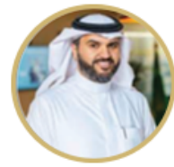
الدكتور ابراهيم الجفالي الرئيس التنفيذي للشراء الاستراتيجي لبرنامج الضمان الصحي وشراء الخدمات الصحية

بعد برنامج التحول الوطني أحد البرامج التنفيذية لتحقيق رؤية المملكة 2030، والذي يعمل على تحديد التحديات التي تواجهها الجهات الحكومية، وبناء القدرات المؤسسية اللازمة؛ لمواكبة أهداف الرؤية الطموحة، فبرنامج التحول في القطاع الصحي هو خارطة طريق طويلة